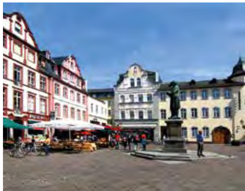
Historisches Ensemble. Der Marktplatz in Koblenz