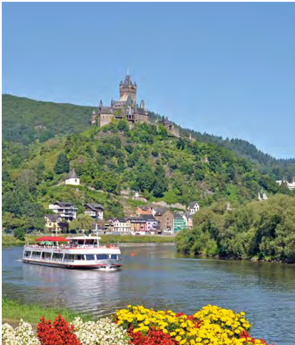
Erbaut um das Jahr 1000 und mehr als 100 m über dem Fluss. Reichsburg Cochem, die größte Höhenburg an der Mosel

deftig ist. Auf kaum einer Speisekarte fehlen darf zum Beispiel das Winzersteak, ein kräftig gewürztes Stück zum Glück meist mageren Schweinefleischs. Zwar ist die Auswahl an Restaurants entlang der Mosel groß; wer aber etwas über dem Durchschnitt sucht, sollte einfach die Gasthöfe in erster Reihe auslassen und in der zweiten schauen.