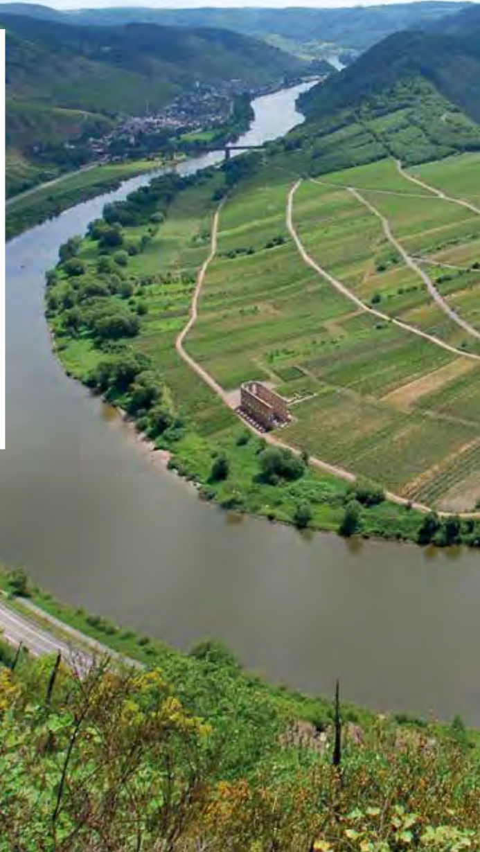
Belohnung nach dem Aufstieg: Blick vom Calmont, Europas steilstem Weinberg

Unter- oder Terrassenmosel wird der Flussabschnitt zwischen Pünderich und der Moselmündung in den Rhein bei Koblenz genannt. Durch sein schmaleres Tal mit steilen und terrassierten Weinbergen unterscheidet sich dieser Abschnitt von der Mittel- und der Obermosel. Er bildet die natürliche Grenze zwischen der Eifel im Norden und dem Hunsrück im Süden. Und bietet alles, was Aktive und Genießer für ein paar entspannende Tage benötigen. Ein Überblick.