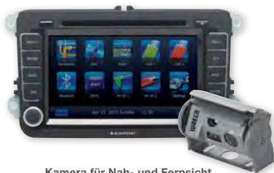
Kamera für Nah- und Fernsicht