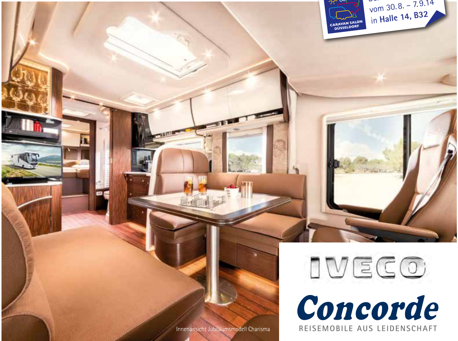
Innenansicht Jubiläumsmodell Charisma

Besuchen Sie uns vom 30.8. – 7.9.14 in Halle 14, B32