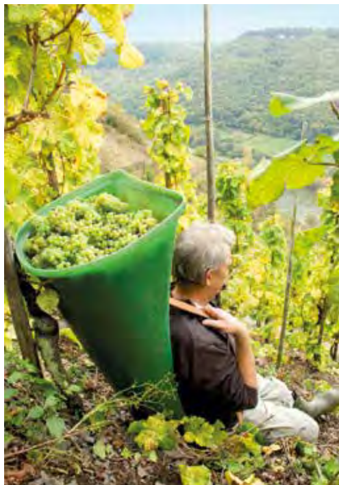
Erst die Arbeit, dann der Riesling. Weinlese in der Steillage