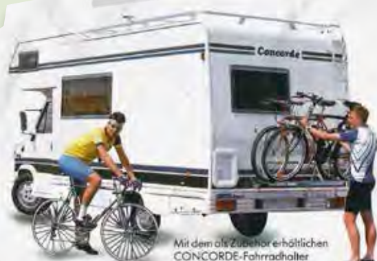
Mit dem als Zubehör erhältlichen CONCORDE-Fahrradhalter können problemlos bis zu drei Fahrräder transportiert werden.

» Das geschah im Jahr 1991 bei Concorde: