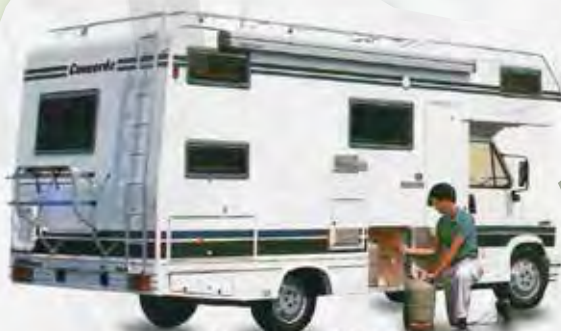
Der Gasvorratsraum faßt zwei 11kg Flaschen und ist nach innen absolut geschützt.