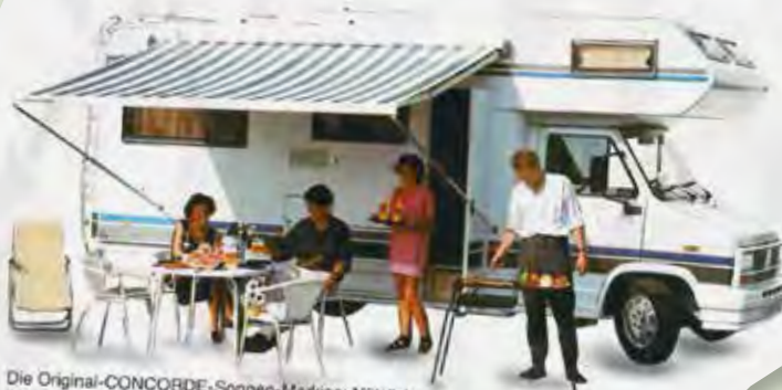
Die Original-CONCORDE-Sonnen-Markise: Nützliches Zubehör für alle, die die Sonne auch mal im Schatten genießen wollen.